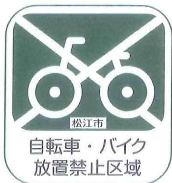
放置禁止区域標識図